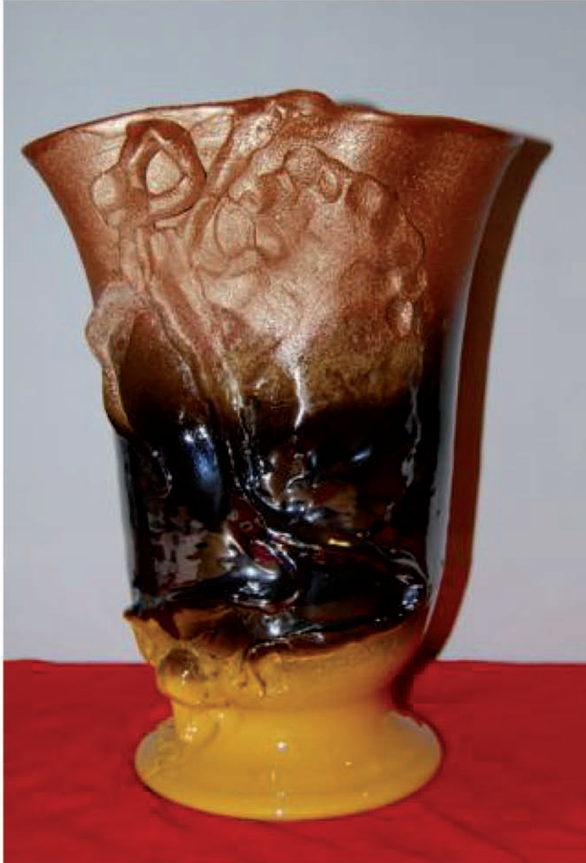
"Vaso astratto" Ceramica invetriata