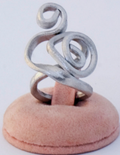
Anello spirale di ispirazione picena in lega di vari metalli.