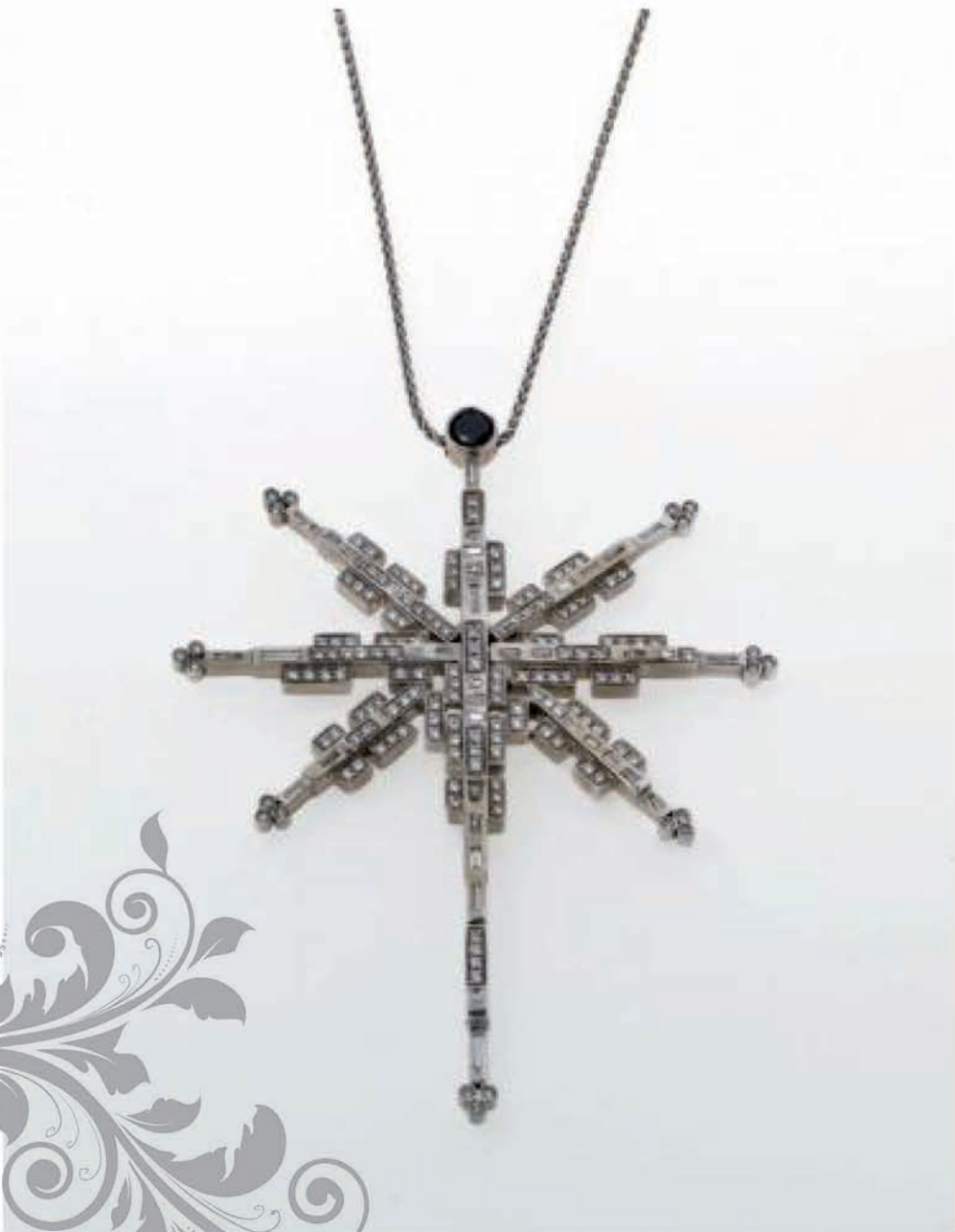
Croce di ispirazione rinascimentale in oro bianco con diamanti baguette e diamanti taglio brillante.