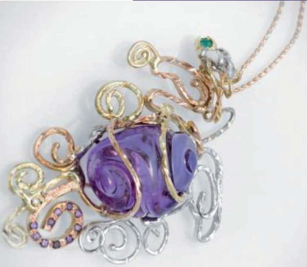
Ciondolo in oro bianco e giallo con ametista incisa.