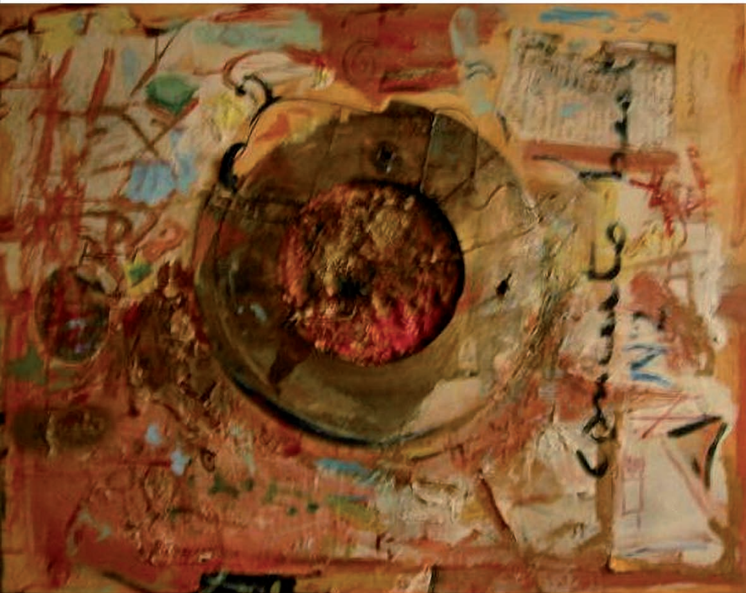
Tele astratte, tecniche miste.