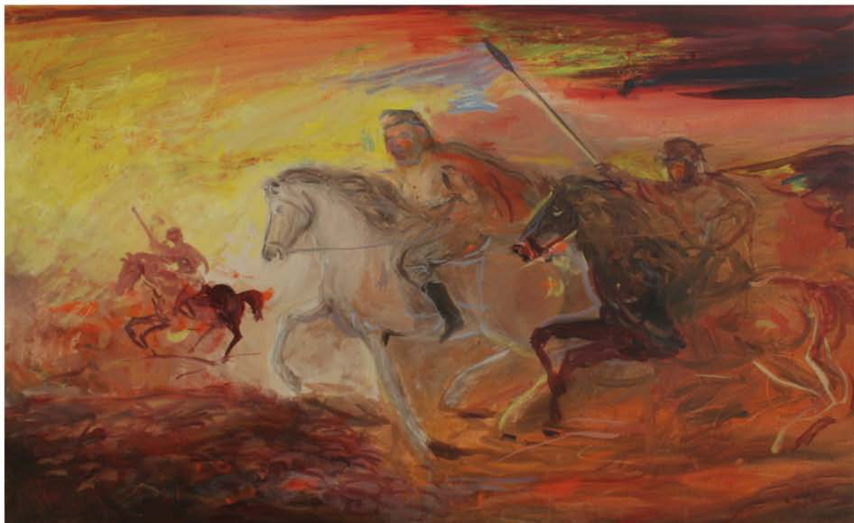
Tele ad olio in memoria di Garibaldi per il 150° anniversario dell'Unità d'Italia

1861 > 2011 >> 150° anniversario Unità d'Italia