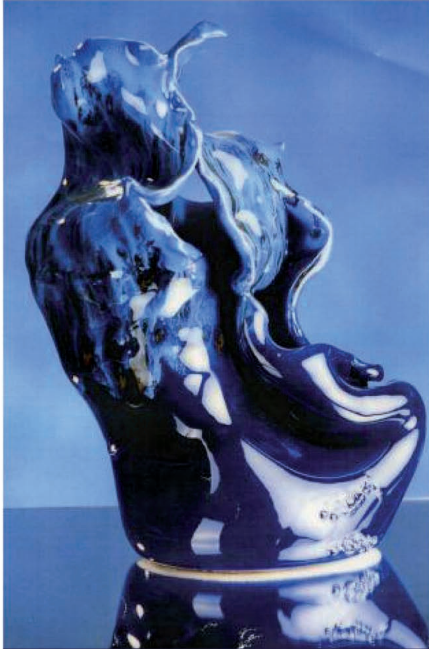
"Il volo" Ceramica invetriata